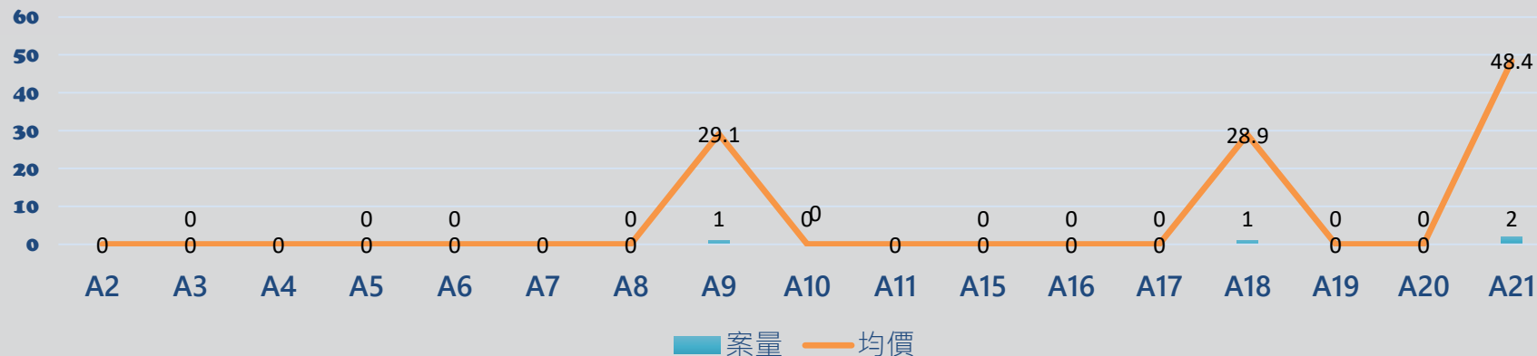
捷運桃園機場線 沿線實價統計