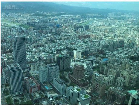
小坪數房子已漸成市場主流。

該民眾表示，高雄本來屬於地廣人稀的地方，而且高雄人有一個特色，那就是「非透天不住的基因，什麼兩房、小三房，都只是天龍國自我感覺『有房子』的安慰」。但前幾天陪朋友去看房子時發現，高雄也開始賣起「兩房」的房子，而且很快就完銷，讓身為土生土長高雄人的他非常不解。