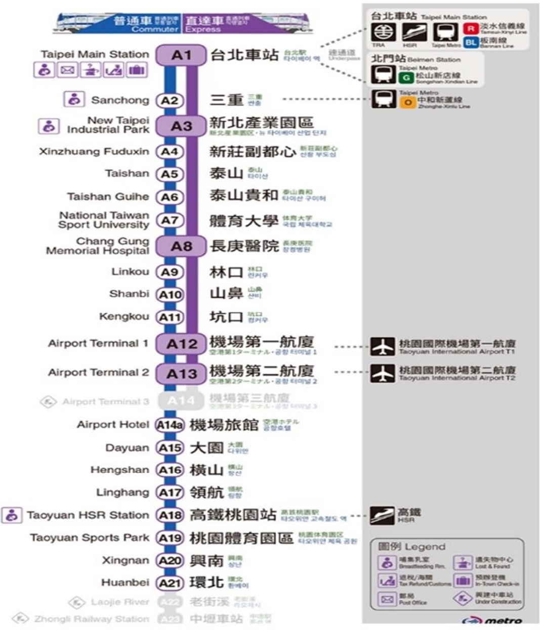
110年6月透天厝捷運桃園機場線沿線實價統計