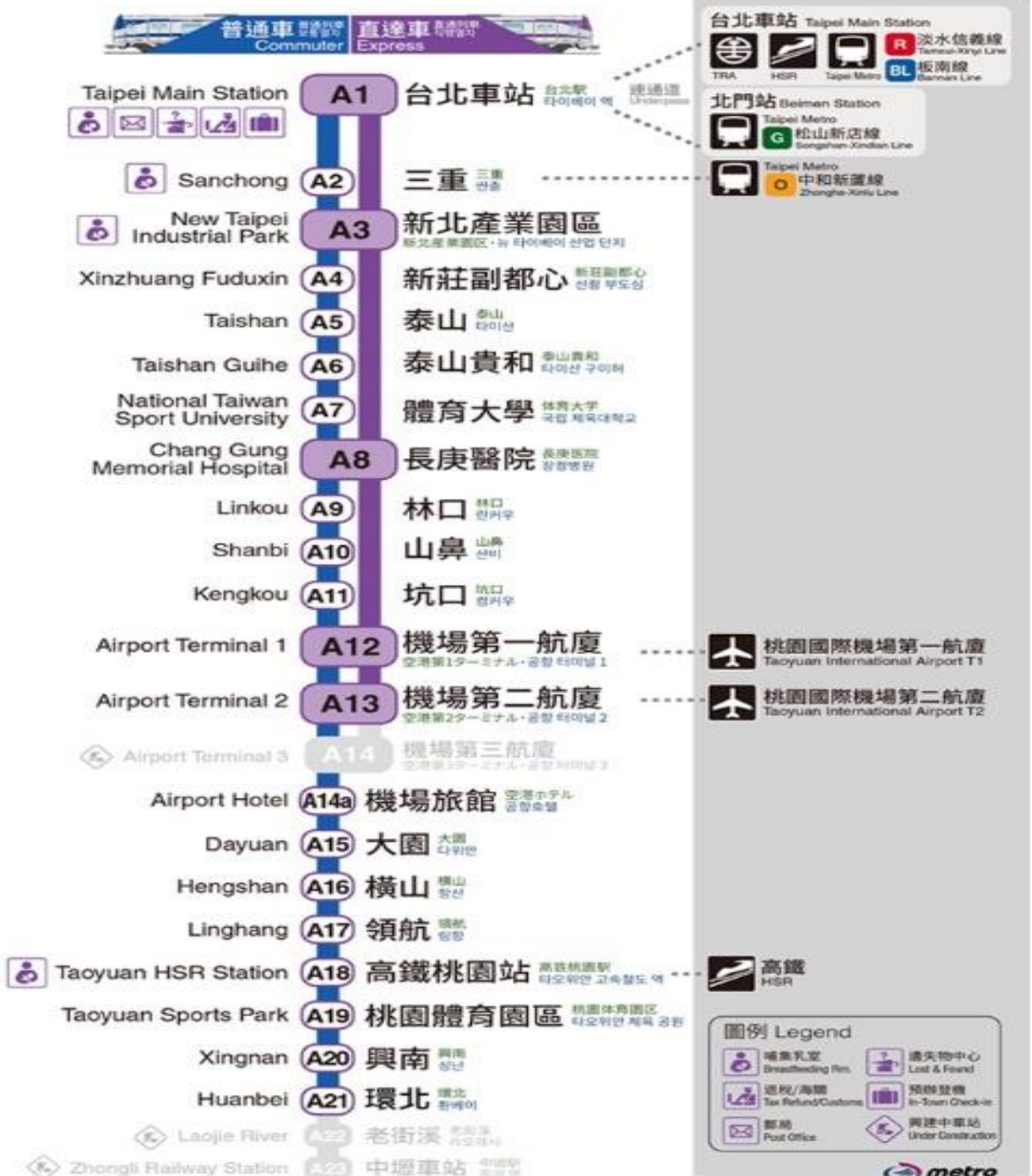
111年12月透天厝捷運桃園機場線沿線實價統計