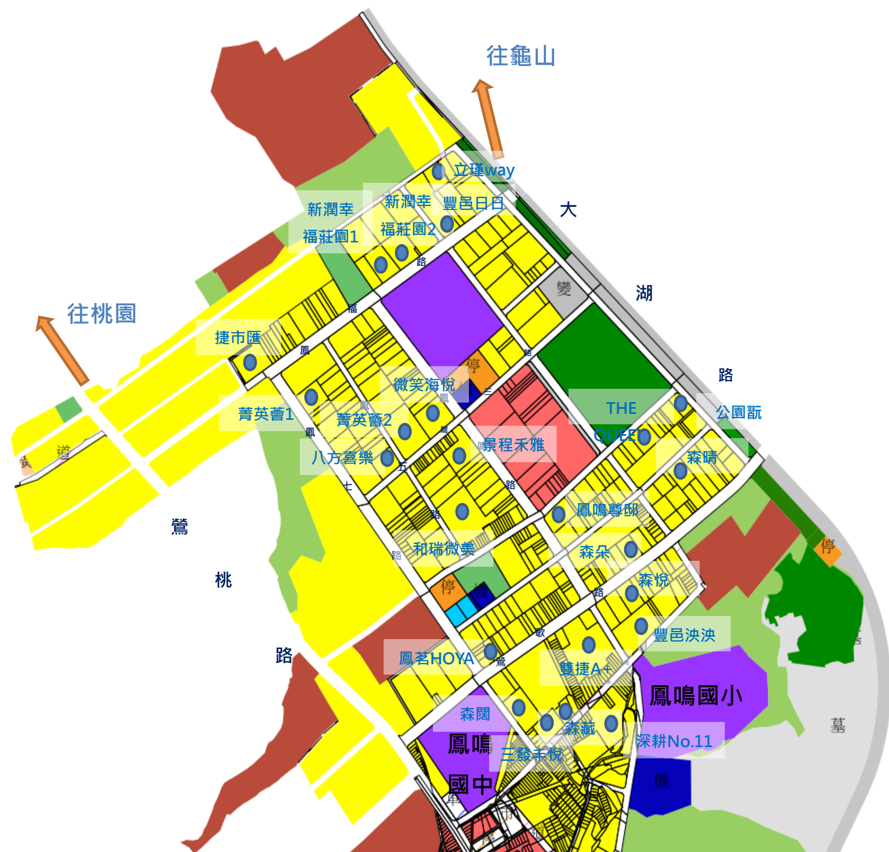
鳳鳴重劃區成交價量分析