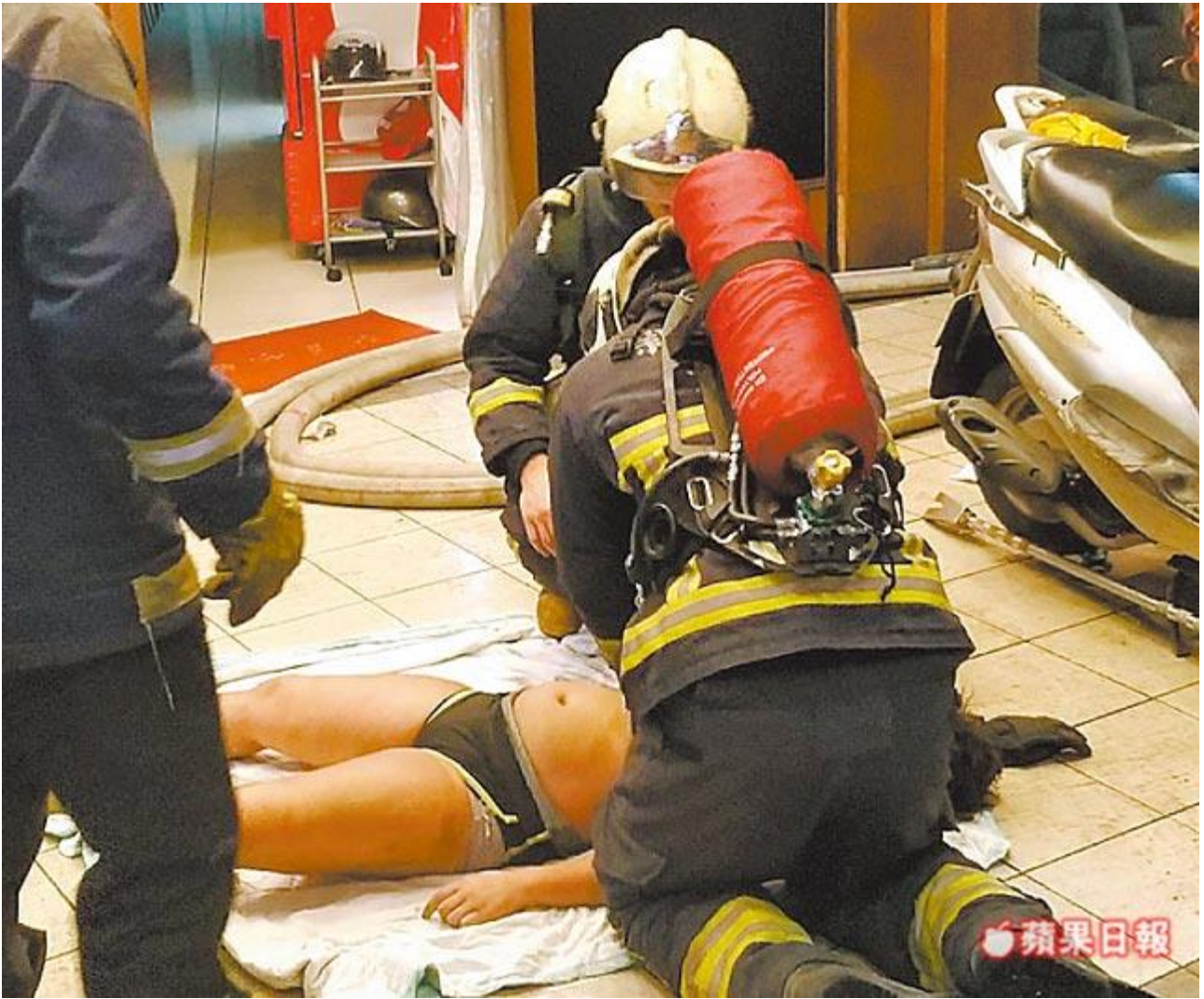
跪地 CPR 警消救出的受困者生命跡象微弱，在現場做 CPR 搶救。