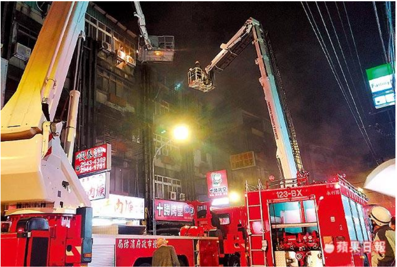
雲梯搜救 發生火警的老舊公寓頂樓是加蓋違建，警消派出雲梯車搶救。翻攝畫面