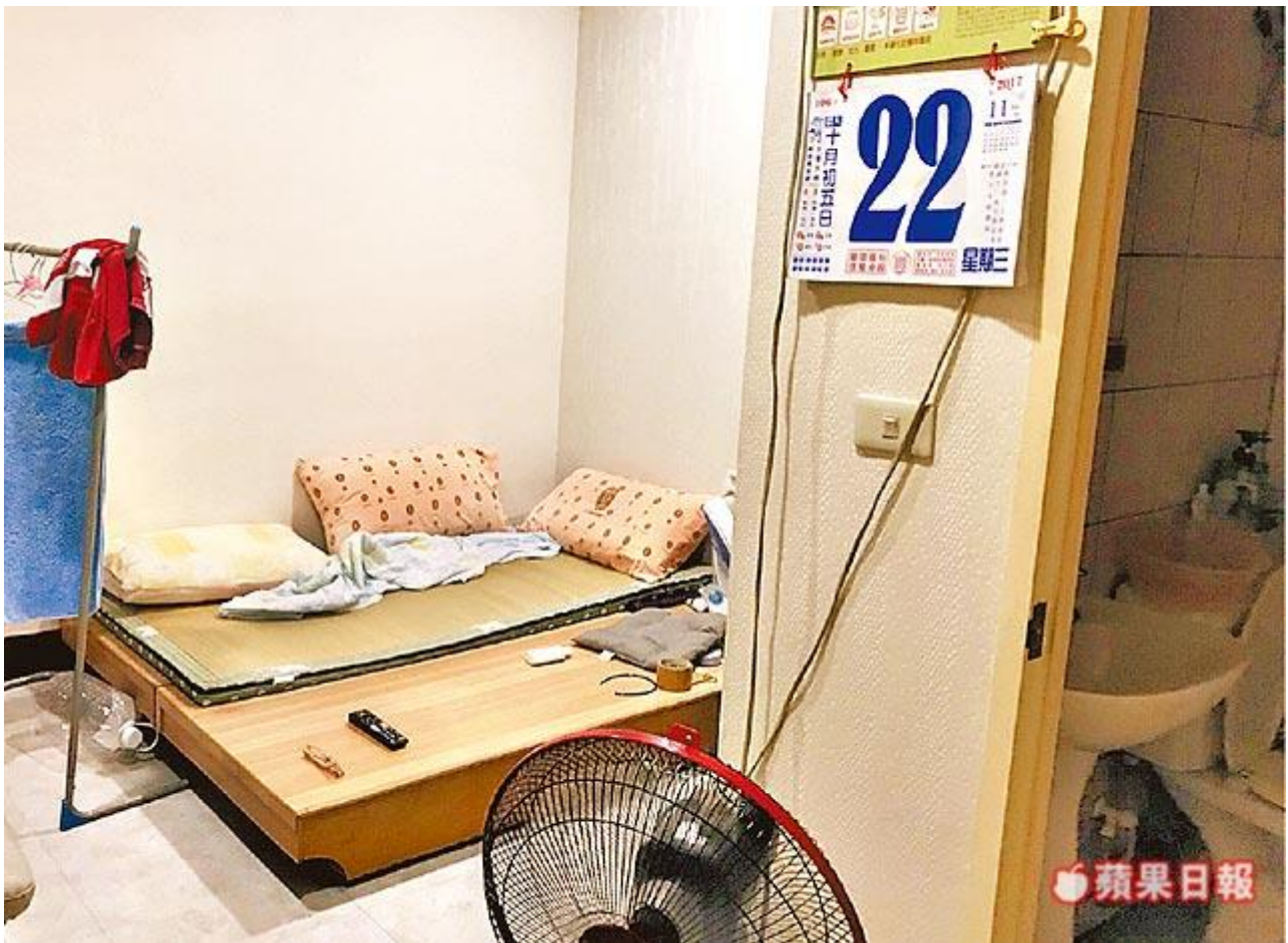
套房原貌 套房全為木板隔間，火勢延燒迅速。