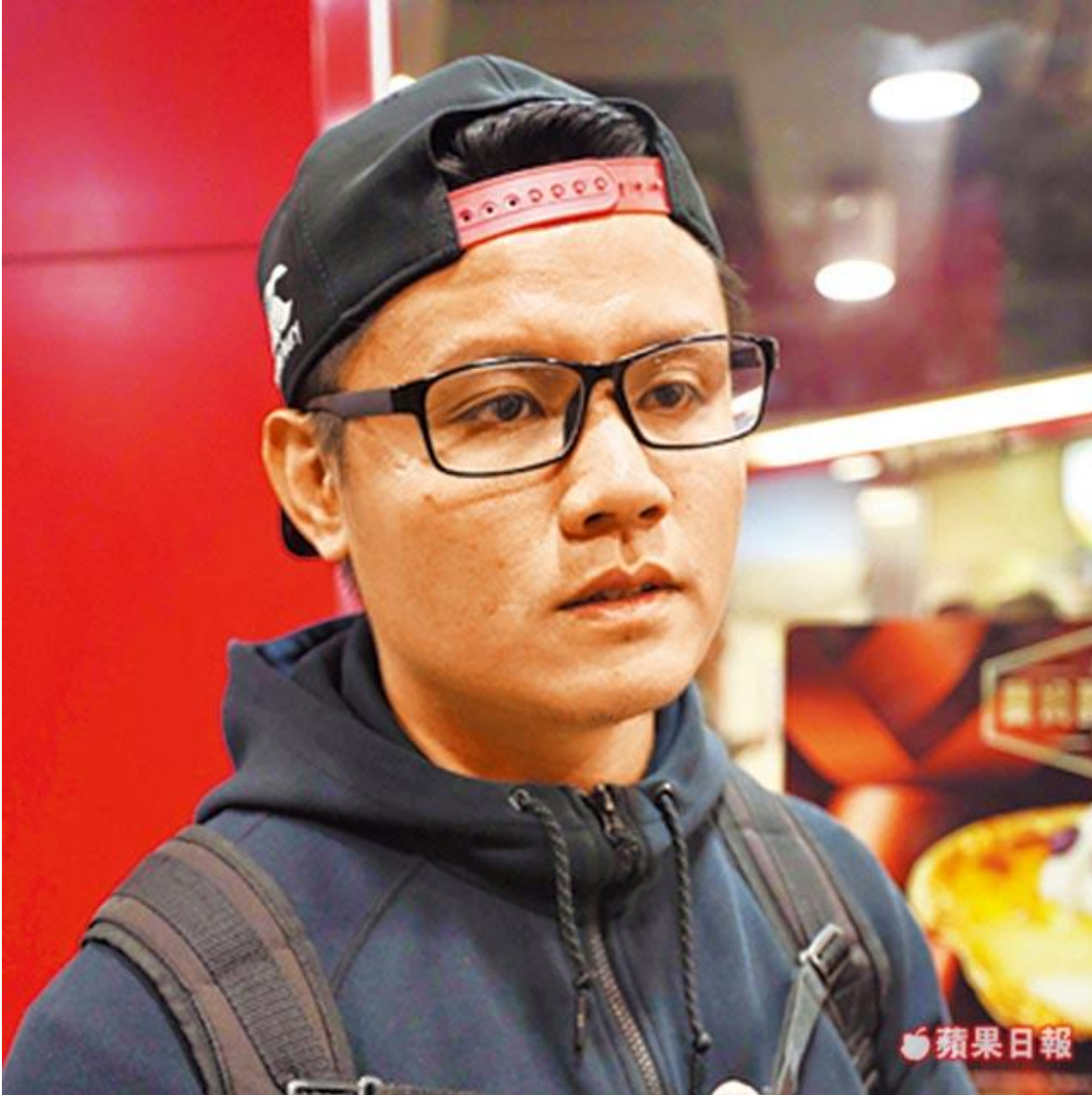
黃先生 30 歲 保險業

我在北市工作在新北三重租了一個月 13000 元的小套房，廢除舊有的違建特赦令，把租屋族的安全當第一優先，我絕對支持。