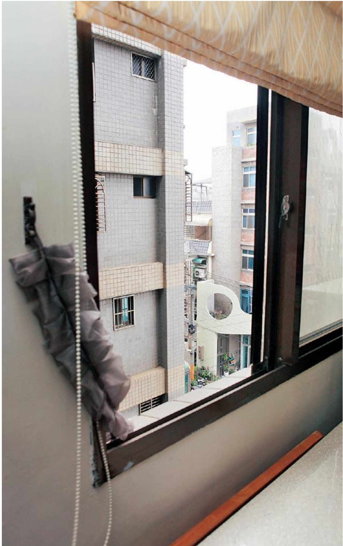
門窗不宜與外物太過逼近，阻擋陽光與空氣影響運勢。