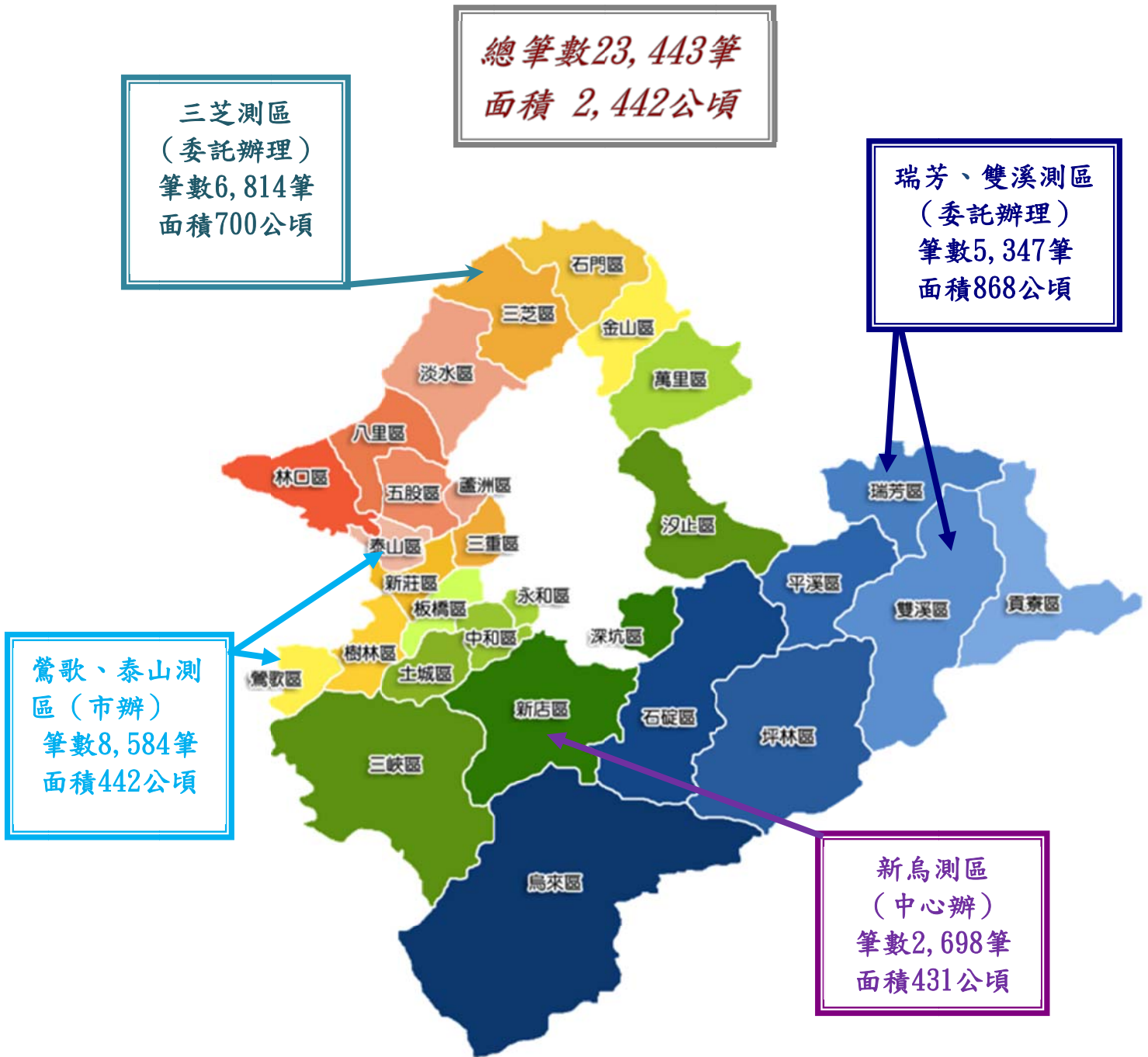
圖 2 105 年辦理地籍圖重測區域、筆數及面積