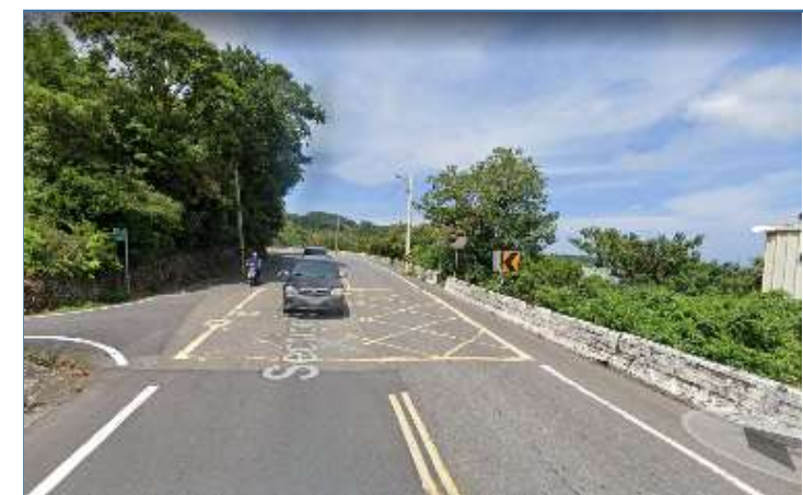
①計畫起點路口(蜿蜒段方向)