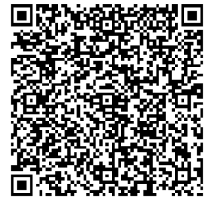
▲可調解之民事事件參考表