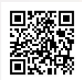
『不動產實價交易查詢網』