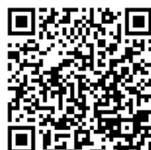
▲中華民國仲裁協會 仲裁服務