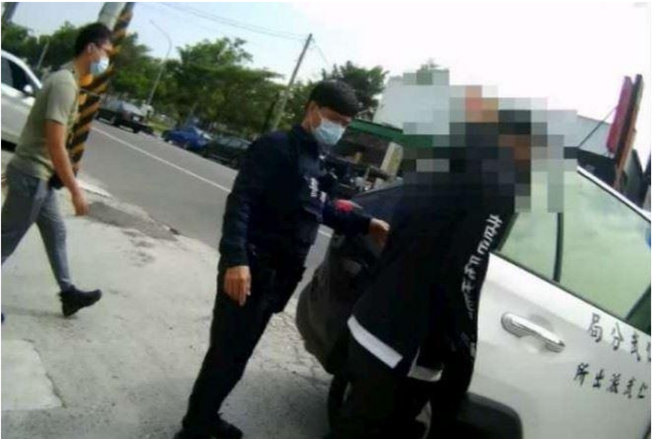
▲警方將計就計，逮捕了廖嫌。

靈骨塔詐騙層出不窮，仁武派出所提醒，如有買賣需求者可逕向各縣市主管機關或殯葬管理處查詢正確公司電話號碼，並查證有無委託買賣仲介事務。凡是聲稱「低風險、高報酬」的投資，務必當心有詐，切勿讓詐騙集團有可趁之機，多一分的求證，自身的財產也就多一分保障。