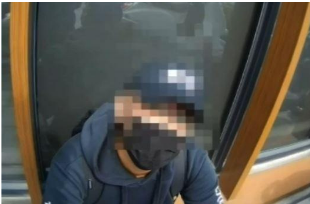
▲男子營稱是地政士人員，向民眾詐騙。