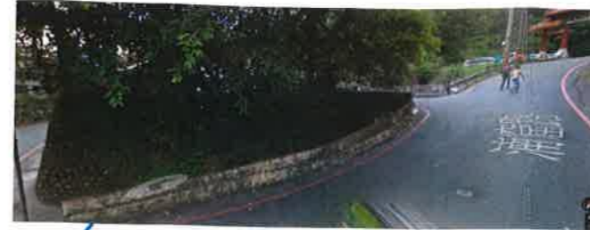
* 現有涵窟路寬度不足6米,且有高差及彎道